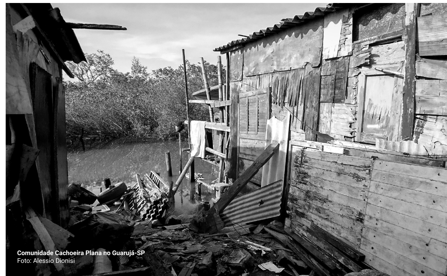
Comunidade Cachoeira Plana no Guarujá-SP

Você como parte de movimentos sociais organizados, coletivos ou entidades e conselhos de classe: ajude-nos a fomentar esta proposta, participando conosco desta construção e deste debate.